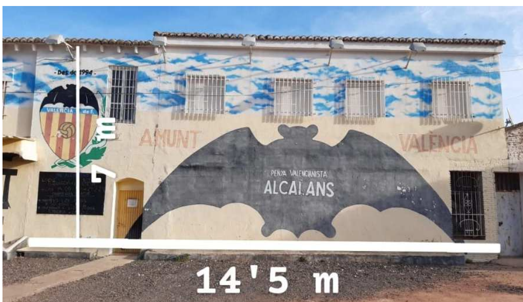
Mesures pared de Montroi