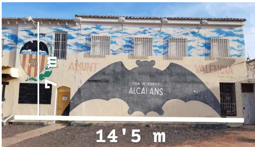
Medidas pared de Montroi